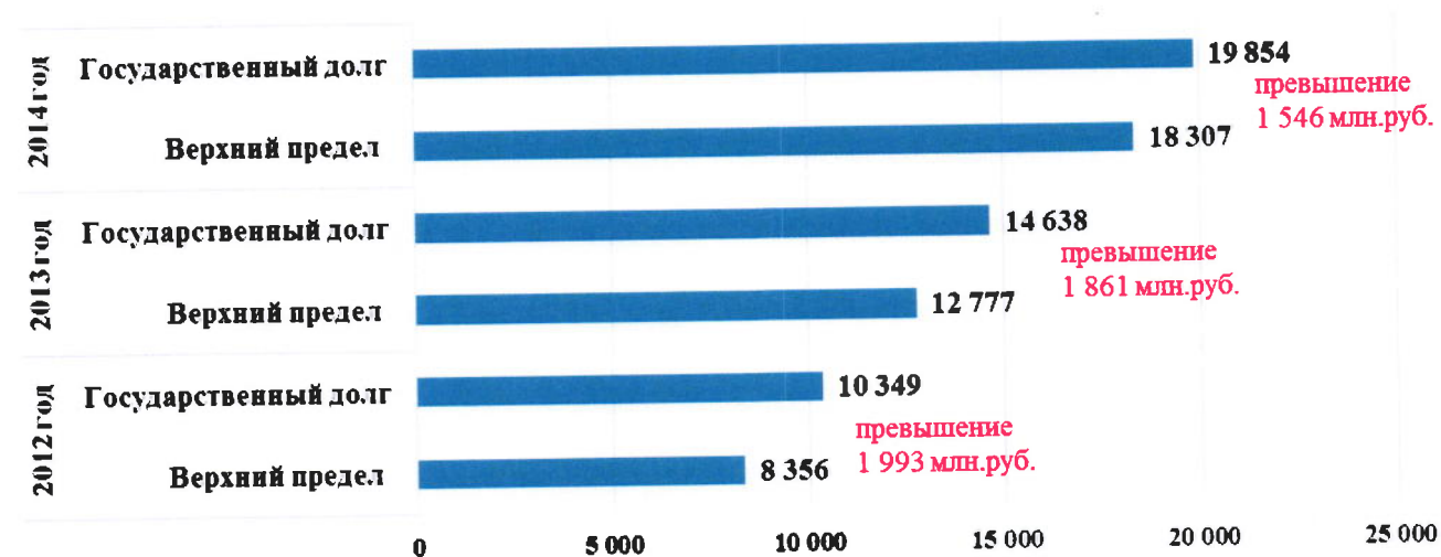
Превышение государственного долга над верхним пределом установленным Законом Томской области об областном бюджете

Таким образом, общее превышение государственного долга над утвержденными значениями верхнего предела государственного внутреннего долга Томской области за период 2012-2014 годов составило 5 400 506,7 тыс.руб.